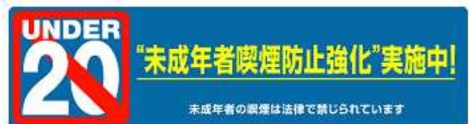
『未成年者喫煙防止強化月間』 ステッカー